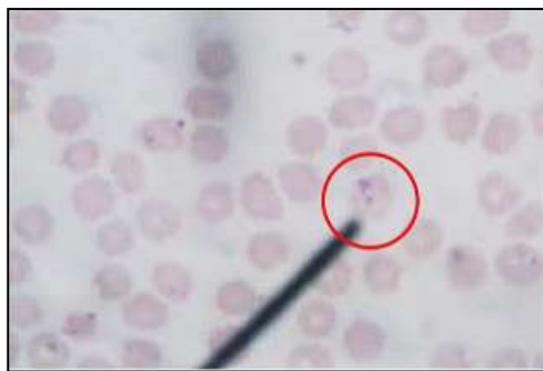
Gambar 1. Babesia sp dalam sel darah merah anjing (lingkaran merah). Pewarnaan Giemsa. Perbesaran 100x.

Pemeriksaan parasit darah menggunakan preparat retikulosit, kemudian menggunakan rumus perhitungan yang sama dengan penghitungan total retikulosit. Hasil yang diperoleh diamati bahwa parasit darah yang ditemukan adalah babesiosis dan presentasi sebesar 0.68%.