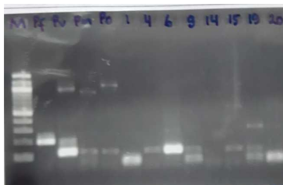
Gambar 1. Hasil PCR MN-06

Pada Gambar 1 tampak pada sampel lain terdapat sedikit band tetapi dicurigai karena kontaminasi sampel MN-06 terdapat band tegas menunjukkan positif Plasmodium Vivax