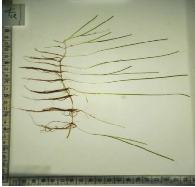
Gambar 2. Halodule pinifolia