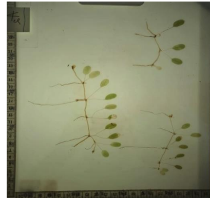
Gambar 4. Halophila ovalis

kemungkinan karena mudah menyerap nutrisi pada substrat yang halus.