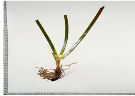
Gambar 8. Enhalus acoroides