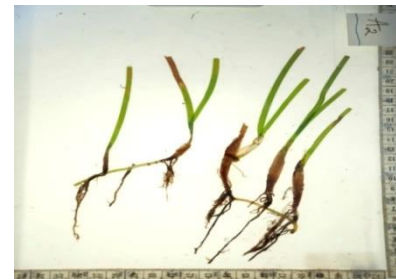
Gambar 5. Cyomdocea rotundata

Jenis lamun ini memiliki ujung daun berbentuk hati atau terlihat seperti huruf m dan pada tepian daun halus (Huky dkk., 2023). C. rotundata (Gambar 5) memiliki daun yang lurus, satu tulang daun, dan 3-4 akar pada tiap bagian percabangan akar.