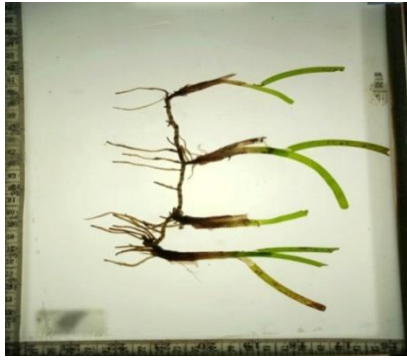
Gambar 6. Thalassia hemprichii