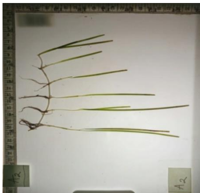
Gambar 3. Halodule uninervis

Halodule uninervis (Gambar 3) merupakan salah satu jenis lamun dari Genus Halodule , sehingga sedikit memiliki kemiripan dengan H. pinifolia , namun ujung daun dari jenis ini terdapat tiga gigi yang meruncing atau yang dikenal dengan istilah trisula. Selain itu, jenis lamun ini memiliki ukuran daun lebih lebar dibandingkan jenis H. pinifolia , namun jenis H. pinifolia memiliki ukuran daun yang lebih panjang.