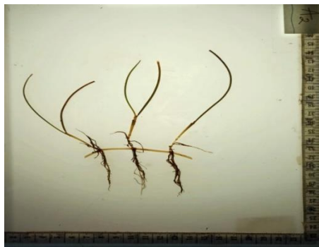
Gambar 7. Syringodium isoetifolium

Bentuk dari jenis S. isoetifolium (Gambar 7) seperti jarum, silindris, dan seperti tabung. Tangkai daun bentuknya berbuku-buku serta ujung daun yang runcing (Mare dkk., 2019).