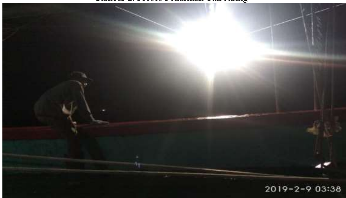
Gambar 3. Cahaya lampu utama