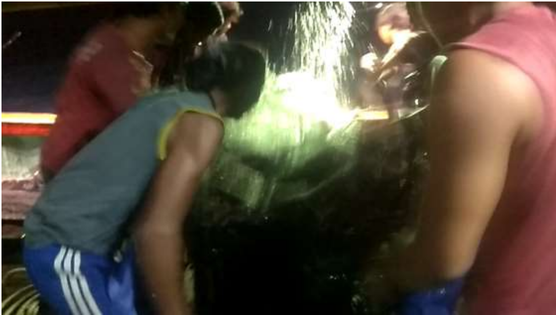
Gambar 4. Penarikan kantong jaring

tangkapan kemudian ditarik secara manual ke geladak kapal dan simpul dibuka untuk mengeluarkan hasil tangkapan.