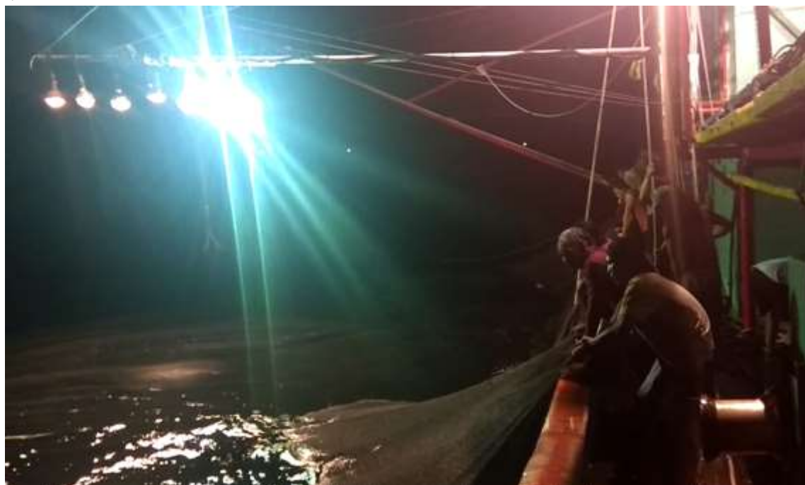
Gambar 2. Proses Penarikan Tali Jaring

lampu utama yang berada pada sisi kanan kapal. Setelah ikan target bergumpul dibawah mulut jaring, maka dilakukan penurunan jaring, sehingga ikan target tangkapan terjebak didalam jaring (Gambar 3).