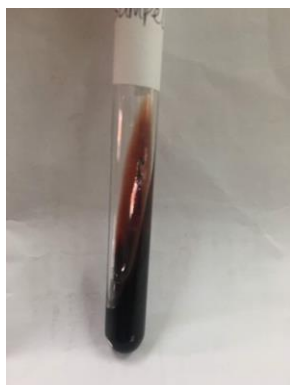
Gambar 3. Media TSIA Hasil Positif

Media TSIA ( Triple Sugar Iron Agar ) merupakan media padat gold standart yang disarankan dalam penanaman bakteri Salmonella sp. sesuai dengan SNI 01-2332.2-2006 tentang cara uji mikrobiologi Salmonella sp. pada produk perikanan, uji biokimia dan serologi dapat menggunakan media TSIA dan LIA ( Lysine Iron Agar ). Menurut WHO tentang isolasi Salmonella sp. pada makanan dan feses hewan berdasarkan ISO 6579, media yang baik untuk uji biokimia dan serologis adalah TSIA atau KIA ( Kliger Iron Agar ), LIA ( Lysine Iron Agar ), Urea Broth, MIO ( Motility- Indol-Ornithine ) dan sitrat.