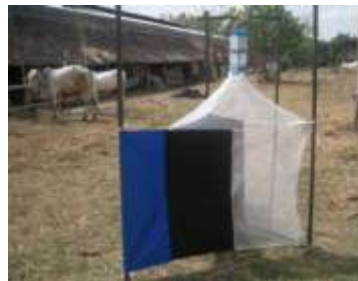
Gambar 1. Perangkap lalat tipe NZ1 yang dipasang di sekitar kandang sapi potong

Penelitian mengenai pengetahuan dinamika populasi lalat-lalat yang berada pada ternak akan mempermudah didalam penanganan populasi lalat secara tepat, penelitian tentang lalat sebaiknya dilakukan pada saat populasi tinggi yang dalam hal ini penelitian sebaiknya dilakukan sepanjang tahun dengan puncak musim hujan khususnya di Indonesia ialah bulan Januari. Sebagai kelengkapan dinamika populasi lalat tersebut masih perlu dilakukan pengamatan lebih intensif setiap jam pada pagi hingga sore hari.