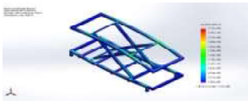
Gambar 5. Analisis tegangan

Pada bagian ini berguna untuk melihat hasil analisa tegangan yang terjadi pada rangka dengan menggunakan pewarnaan pada rangka, besar nilai tegangan diinginkan dengan nilai warna yang dikeluarkan disebelah kanan gambar. Untuk lebih jelasnya dilihat pada gambar klik kanan di result > stress. Untuk lebih jelasnya dilihat pada Gambar 5 berikut ini,