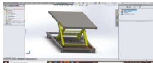
Gambar 3. Hasil assembly

Setelah proses assembly selesai maka proses selanjutnya yaitu proses simulasi yang mana pada proses simulasi ini guna untuk mengetahui besar gaya reaksi pada rangka. sebelum melakukan simulasi ada beberapa fitur yang harus diaktifkan , diantaranya bahan yang akan dianalisa. Untuk menjalankan simulasi digunakan sebagai berikut :