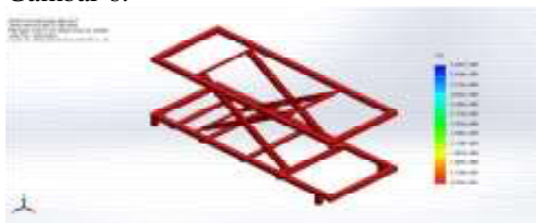
Gambar 6. Faktor keamanan

Klik kanan diresult >factor of safety. untuk lebih jelasnya dapat dilihat pada Gambar 6.