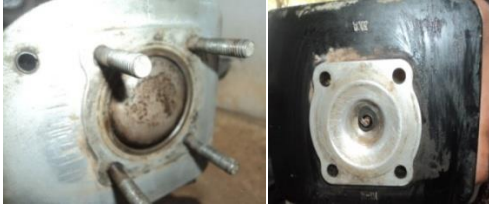
Gambar 3. Kondisi komponen mesin sebelum di uji

Pada pengujian ini langkah pertama yang dilakukan adalah melakukan pembersihan kerak pada ruang bakar (Gambar 3) sehingga memudahkan dalam pengamatan. Pengujian pertama yang dilakukan adalah pengamatan untuk campuran bensin dengan 10% minyak jelantah selama 50 jam pengujian. Dari hasil pengujian ini kerak (deposit) yang dihasilkan dalam campuran bensin dengan minyak jelantah berbentuk jelaga ( soot ) berwarna coklat kemerah-merahan (Gambar 4). Warna coklat kemerahan ini berasal dari zat karoten yang ada pada minyak jelantah.