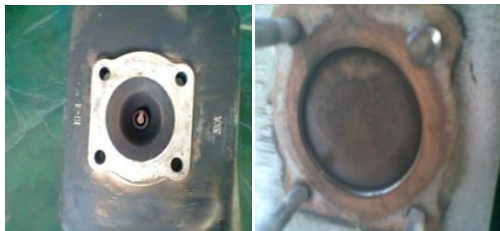
Gambar 4. Kondisi komponen setelah diuji menggunakan campuran bensin dan minyak jelantah.

Pada pengujian ini langkah pertama yang dilakukan adalah melakukan pembersihan kerak pada ruang bakar (Gambar 3) sehingga memudahkan dalam pengamatan. Pengujian pertama yang dilakukan adalah pengamatan untuk campuran bensin dengan 10% minyak jelantah selama 50 jam pengujian. Dari hasil pengujian ini kerak (deposit) yang dihasilkan dalam campuran bensin dengan minyak jelantah berbentuk jelaga ( soot ) berwarna coklat kemerah-merahan (Gambar 4). Warna coklat kemerahan ini berasal dari zat karoten yang ada pada minyak jelantah.