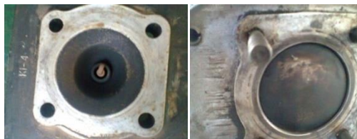
Gambar 5. Kondisi komponen setelah diuji menggunakan campuran bensin dan oli samping.

Setelah itu dilakukan pembersihan komponen untuk melakukan pengujian berikutnya. Pengujian kedua yang dilakukan