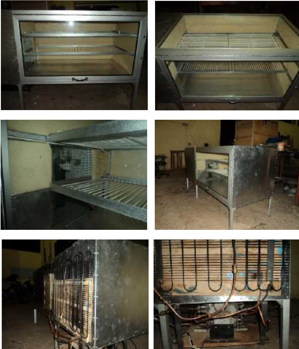
Gambar 1. Hasil rancangbangun lemari pendingin