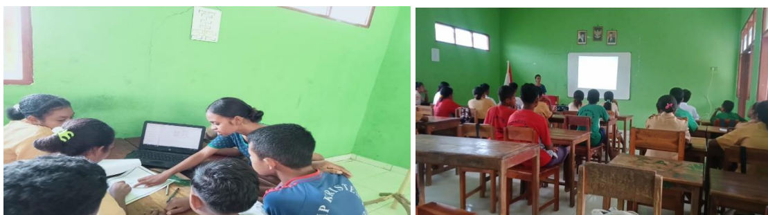
Gambar 1 Pelaksanaan pembelajaran siklus I

Pada tahap pelaksanaan tindakan, peneliti mulai melaksanakan kegiatan pembelajaran dengan menerapkan model problem based learning dengan berbantuan aplikasi GeoGebra . Pelaksanaan kegiatan pembelajaran terdiri 3 bagian yaitu kegiatan pendahuluan, kegiatan inti, dan kegiatan akhir. Guru mengajar dan memfasilitasi siswa untuk belajar dengan memanfaatkan media aplikasi GeoGebra baik pada saat mengamati masalah maupun saat menyelesaikan permasalahan dalam LKPD.