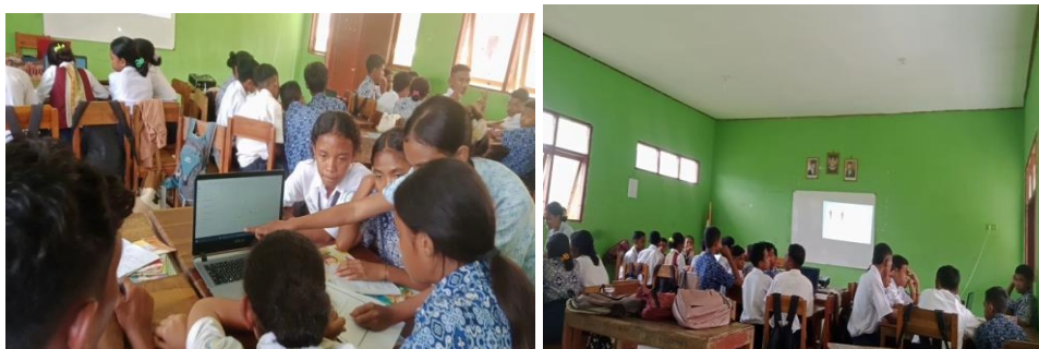
Gambar 2. Pembelajaran siklus II

dengan mengacu pada rencana perbaikan pada tahap refleksi siklus I, sehingga kegiatan pembelajaran berlangsung sesuai rencana dan suasana kelas tetap kondusif. Kemudian guru lebih menekankan akan konsep dari materi yang dipelajari sehingga siswa memahami materi yang dipelajari secara baik.