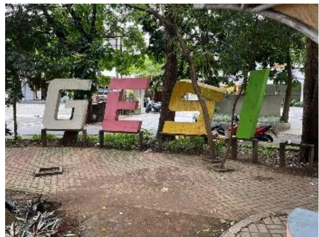
Gambar 4. Elemen Nama Taman Gesit

Selain itu, keberadaan daun kering dan sisa material alami yang tidak dibersihkan secara rutin turut memengaruhi persepsi kebersihan taman. Area taman yang seharusnya menjadi ruang terbuka hijau yang bersih dan nyaman justru terkesan kurang terawat pada beberapa titik, sehingga dapat mengurangi kenyamanan pengunjung dalam beraktivitas di taman.