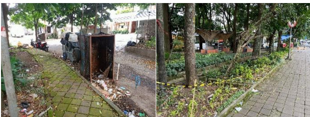
Gambar 3. Kebersihan Taman Gesit

Kondisi fisik dan pemeliharaan bangku taman terlihat mengalami kerusakan pada beberapa bagian, seperti retakan pada permukaan dan sudut bangku serta lapisan cat yang mulai pudar dan terkelupas. Kondisi tersebut dapat mengurangi kenyamanan pengunjung saat menggunakan fasilitas ini, baik dari segi keamanan maupun kebersihan.