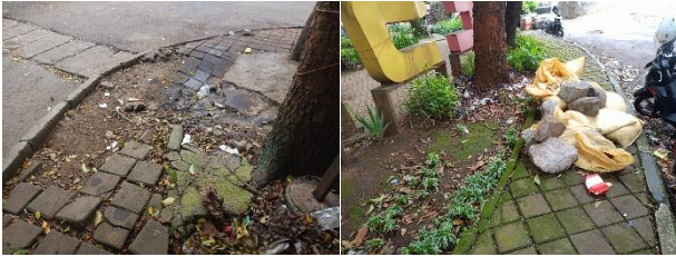
Gambar 1. Jalur Pejalan Kaki Taman Gesit

Untuk memberikan gambaran nyata mengenai kondisi fisik taman yang dinilai oleh responden, penelitian ini dilengkapi dengan dokumentasi visual Taman Gesit Bandung yang disajikan pada gambar-gambar berikut.