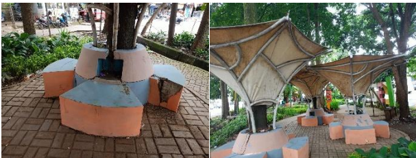
Gambar 2 Bangku Taman Gesit

Selain itu, keberadaan sampah dan daun kering di sekitar jalur pejalan kaki turut memengaruhi kenyamanan pengguna jalur. Area yang kurang terawat ini menunjukkan bahwa pemeliharaan jalur pedestrian masih perlu ditingkatkan agar fungsi jalur sebagai sarana sirkulasi pejalan kaki dapat berjalan dengan baik.