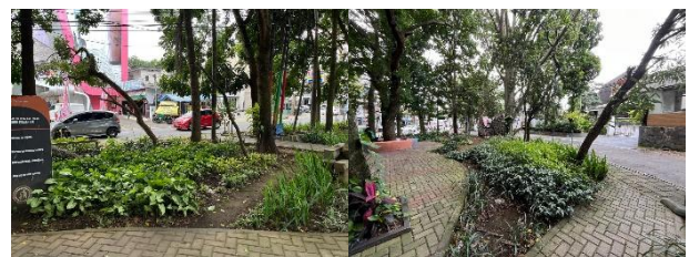
Gambar 5 Kondisi Vegetasi Taman Gesit

Namun demikian, dari segi kondisi fisik dan pemeliharaan, elemen nama taman terlihat mengalami penurunan kualitas, seperti cat yang mulai pudar, permukaan yang kotor, serta area sekitar yang kurang terawatt.