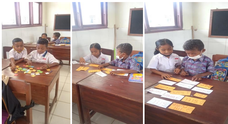
Gambar 3. Pelaksanaan Pembelajaran Siklus 2