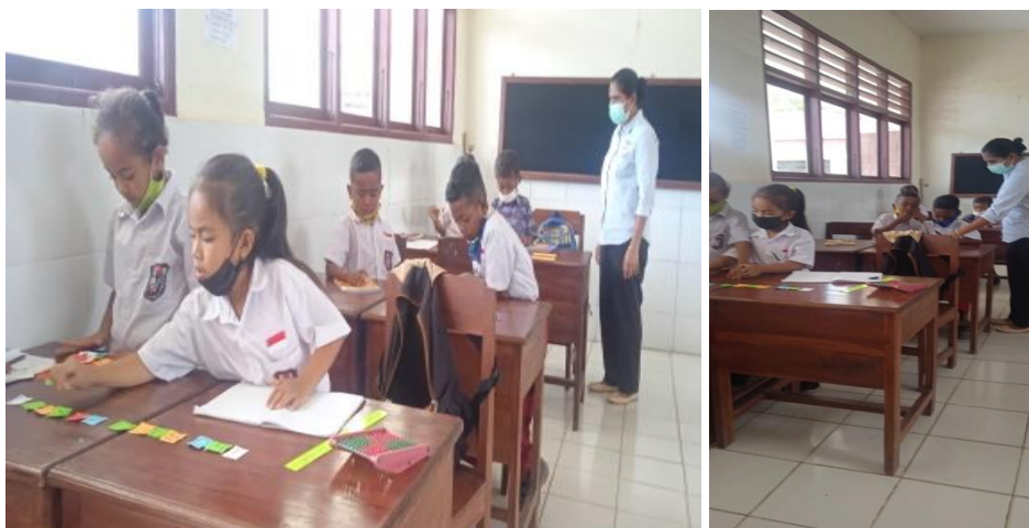
Gambar 2. Pelaksanaan Pembelajaran Siklus 1