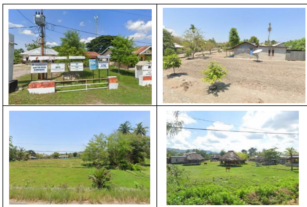
Gambar 1: Observasi masalah sosial

Tahap observasi dan pemetaan masalah sosial, tahap ini dilakukan pada awal kegiatan bertujuan untuk menemukan akar masalah sosial yang ada di masyarakat yang dapat diatur dalam peraturan desa. Masalah sosial yang ditemukan berdasarkan hasil wawancara singkat dengan aparat desa dan masyarakat serta hasil observasi lapangan ditemukan bahwa sering terjadinya kasus hewan ternak masuk dan merusak tanaman di pekarangan dan perkebunan milik masyarakat, hal ini disebabkan karena pemilik ternak tidak mengikat, mengkandangan dan mengembalakan ternaknya secara baik. Masalah sosial lainnya adalah pemilik kebun dan pekarangan tidak memagarai pekarangan dan perkebunan dengan baik, sehingga hewan ternak dapat masuk dan merusak tanaman yang ada pada pekarangan dan perkebunan warga tanpa adanya halangan. Tahapan observasi dan pemetaan masalah sosial ini dilaksanakan pada tanggal 28 sampai dengan tanggal 29 Juli 2025.