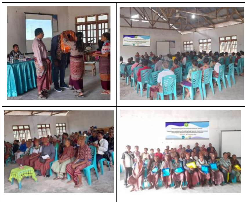
Gambar 2: Pelaksanaan Kegiatan Pelatihan

hipotesis ROCIPI untuk diisi oleh peserta pelatihan terkait masalah sosial apa yang ditemukan terkait draf ranperdes penertiban ternak. Tabel hipotesis yang diisi terdiri dari: siapa pelakunya (pemegang peran), perilaku bermasalah apa yang dilakukan, setelah itu dianalisis berdasarkan ROCIPI. Kegiatan hari ke 2 (dua) dilanjutkan dengan pemaparan materi tentang: Menyusun Solusi; Teknik Menyusun Rancangan Peraturan; dan Petunjuk Praktis Penyusunan Rancangan Peraturan Daerah, setelah penyajian materi dilanjutkan dengan diskusi pengisian tabel hipotesis lanjutan pada kolom solusi yang ditawarkan untuk setiap masalah sosial yang ada berdasarkan ROCIPI.