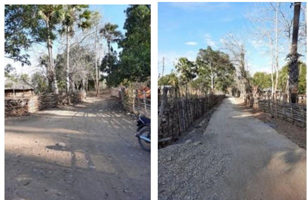
Gambar 1. Kondisi jalan dusun yang belum beraspal

Dusun Niskolen, Desa Tuapanaf, Kecamatan Takari, adalah salah satu dusun di Kabupaten Kupang yang akses transportasi ke dusun ini tergolong sulit, karena tidak adanya jalan beraspal yang menuju ke dusun tersebut (Gambar 1). Sebagian besar warga di dusun tersebut adalah petani yang tergolong keluarga prasejahtera yang rumahnya semi permanen dan sangat sederhana. Walaupun sumber penghasilan warga berasal dari bertani dan beternak, namun sebagian besar warganya masih sulit untuk mendapatkan dan memenuhi kebutuhan dasar akan listrik (Gambar 2). Hal ini disebabkan tidak adanya infrastruktur berupa pasokan dan distribusi jaringan listrik PLN yang dapat menjangkau dusun tersebut [2].