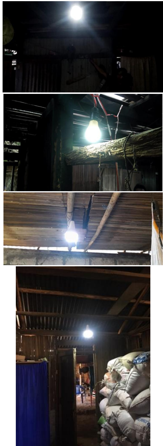
Gambar 5. Penerangan yang dihasilkan SHS.

mitra dalam memasang dan merawat komponen dan sistem penerangan rumah yang digunakan.