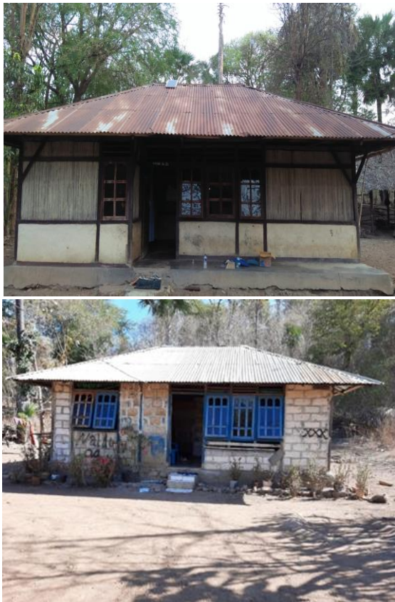
Gambar 2. Rumah-rumah warga yang belum dialiri listrik dari PLN

Program pemerintah ini perlu didukung oleh perguruan tinggi sebagai stakeholder pendukung yang tidak memiliki kaitan kepentingan secara langsung terhadap kebijakan energi pemerintah, tetapi memiliki kepedulian ( concern ) dan keprihatinan sehingga turut membantu masyarakat dalam pemenuhan listrik di daerah pelosok. Oleh karena itu, tim pengusul melalui kegiatan ini akan melakukan diseminasi dan alih teknologi solar home system (SHS) dengan menggunakan lampu hemat energi bagi mitra (dua keluarga petani) di dusun Niskolen.