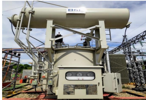
Gambar 4.2 Transformator 2