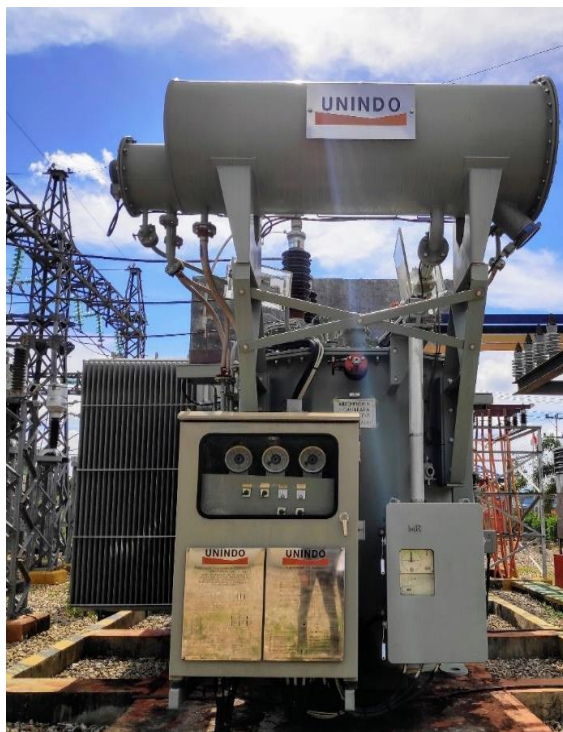
Gambar 4.1 Transformator 1

Merk : Unindo Serial Number : P030HE680-02 Year Of Manufactured : 2012 Power : 30 MVA Rated Voltage : 66/20 Cooling : ONAN/ONAF Frequency : 50 HZ Phases : 3 Position Of OLTC : 17 Tap Positions