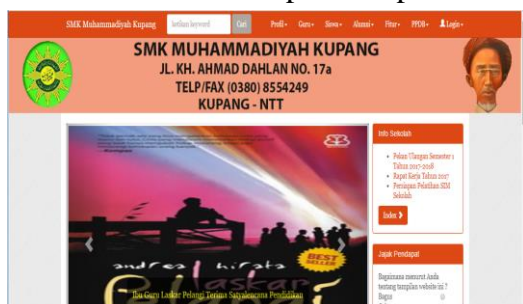
Gambar 3.1 Front End Website

Gambar 3.1 memperlihatkan tampilan front end website yang telah dibuat. Front end website adalah salah satu komponen yang terdiri dari beberapa modul yang dapat diakses oleh pengguna tanpa harus melakukan proses registrasi terlebih dahulu. Modul pada front end ini, dapat diubah atau dimodifikasi oleh administrator sehingga semua pihak administrator sekolah dapat memperlihatkan