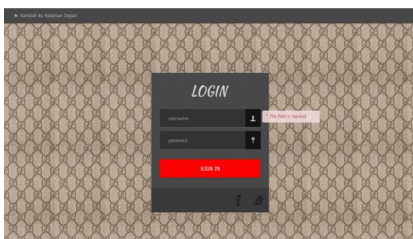
Gambar 3.6. Halaman Login

Back End adalah salah satu komponen yang berfungsi untuk mengatur dan mensetting semua menu dan data yang ada di website (Gobel, 2016). Komponen back end ini hanya dapat diakses oleh super admin dan admin-admin yang telah didaftarkan sebelumnya oleh super admin. Adapun tampilan loginnya dapat dilihat pada gambar 3.6