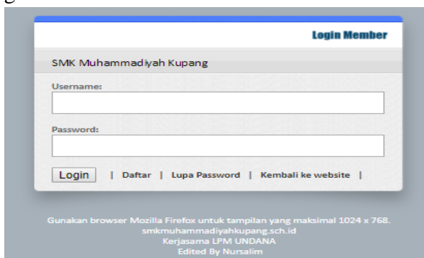
Gambar 3.4. Halaman Login

Adapun tampilan login 3.4 dan tampilan menu sistem informasi ini dapat dilihat pada gambar 3.4.