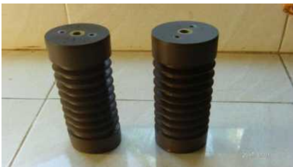
Gambar 1. Isolator Uji

Bahan pengujian meliputi semua bahan yang diperlukan untuk melakukan pengujian, baik sebagai bahan uji maupun yang membantu pengujian. Bahan pengujian ini terdiri dari isolator uji, bahan pengotor, bahan pelapis ( coating ), pelarut pelapis ( solvent ) dan air distilasi. Bahan kontaminan dibuat dari campuran sejumlah garam laut dengan bahan tak larut berupa 40 gram kaolin untuk setiap 1 liter air destilasi dan bahan kontaminan semen kupang.