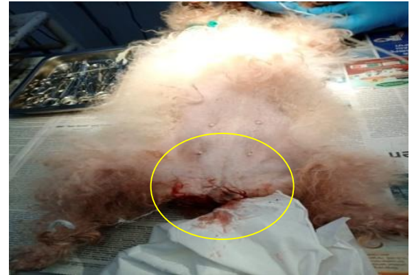
Gambar 1. Gejala klinis pyometra terbuka pada anjing poodle. Terdapatnya leleran berwarna merah yang keluar dari vulva.

Hasil pemeriksaan fisik anjing sydney yaitu temperatur 39,4^{\circ}\text{C} , frekuensi nafas 25 kali/menit, frekuensi pulsus 108 kali/menit, dan abdomen mengalami distensi.