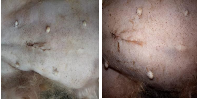
Gambar 4. Luka hari ke-4 pasca operasi (terlihat luka pada gambar kiri dan kanan bahwa bagian luka sudah mulai mengalami penyatuan dan pengeringan).

ditandai dengan tidak terjadinya pembengkakan dan luka sudah mulai mengering. Pada hari ke-8 pasca operasi ovariohisterektomi tepi luka sudah menyatu sempurna.