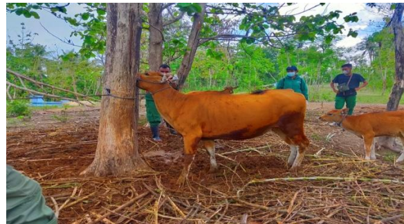
Gambar 3. Kondisi umum Pemeliharaan sapi di Desa Baumata Timur

pemerintahan Kecamatan Taebenu, Kabupaten Kupang yang dimana salah satu mata pencaharian masyarakat dengan beternak hewan. Jenis ternak yang dipelihara oleh masyarakat di Desa Baumata Timur antara lain : sapi, babi ,dan kambing. Menurut Dinas Peternakan Kabupaten Kupang (2020), Populasi Sapi di desa Baumata Timur mencapai 505 ekor. Kondisi umum pemeliharaan sapi di Desa Baumata Timur pada Gambar 3.