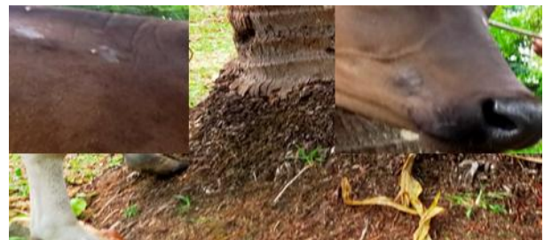
Gambar 4. Gejala Klinis Ringworm pada sapi bali berupa nodul, keropeng & alopesia pada daerah wajah, punggung (lingkaran merah )

Berdasarkan hasil pengamatan secara langsung ternak sapi bali di Desa Baumata Timur terlihat adanya gejala klinis pada sapi bali berupa keropeng dan nodul pada daerah wajah dan punggung. Hasil ini sama dengan penelitian Simarmata et al. , (2018) yang menunjukkan adanya gejala klinis pada sapi bali berupa nodul multifokal, alopesia, keropeng