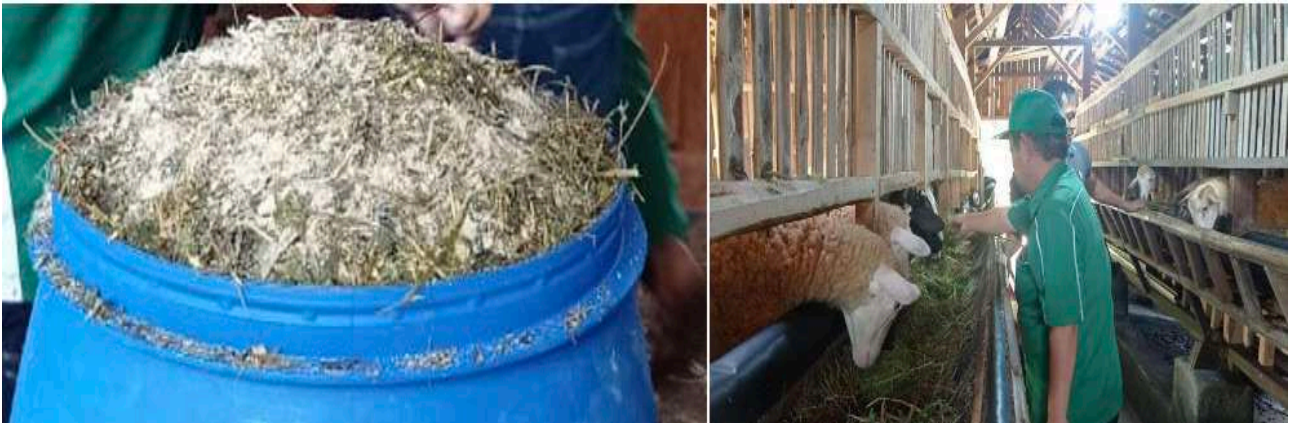
Gambar 5. Penilaian organoleptik dan uji palatabilitas complete feed hasil pelatihan

Gula dan asam amino bebas pada reaksi ini akan membentuk polimer yang nantinya akan terdeteksi sebagai fraksi serat (ADF) dan nitrogen tidak terlarut dalam detergen asam. Silase yang baik memiliki warna yang tidak jauh berbeda dengan warna bahan bakunya, memiliki pH rendah dan beraroma asam (Abdelhadi et al. , 2005), bertekstur lembut, tidak berjamur dan tidak berlendir (Farda et al. , 2023).