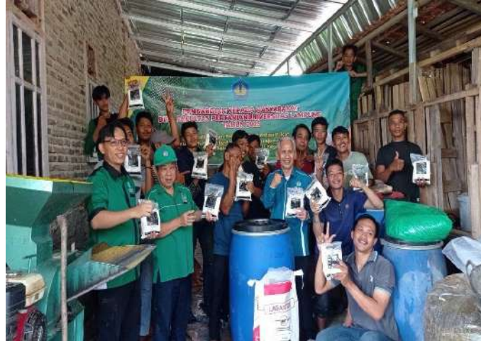
Gambar 7. Pembagian bantuan 1 kg mineral premix Lagantor® kepada tiap peserta kegiatan pengabdian

mempertahankan fisiologis normal tubuh dan menjaga kesehatan ternak maka Tim PKM DIPA FP memberikan bantuan mineral premix Lagantor kepada para peserta pengabdian (Gambar 7).