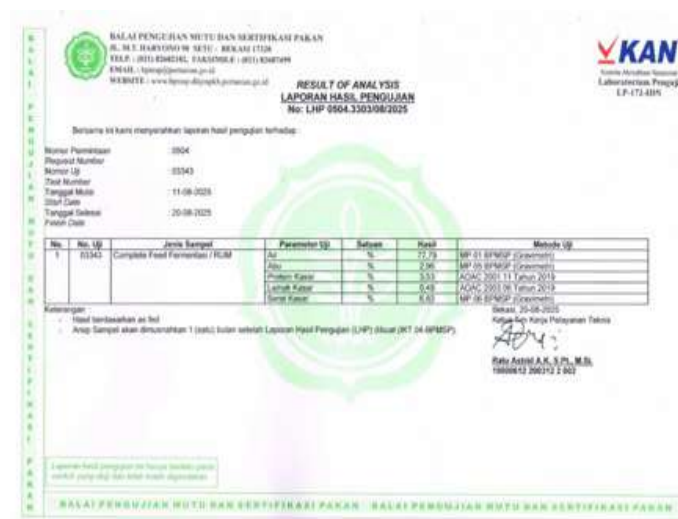
Gambar 6. Hasil analisis proksimat fermentasi pakan di Balai Pengujian Mutu dan Sertifikasi Pakan Dirjen PKH Kementerian Pertanian RI, 2025

pakan secara silase. Hasil fermentasi pakan berdasarkan As Fed dengan analisis proksimat di Balai Pengujian Mutu dan Sertifikasi Pakan Direktorat Jenderal Peternakan dan Kesehatan Hewan Kementerian Pertanian RI mengandung 3,53% protein kasar, 0,49% lemak kasar, 6,83% serat kasar, dan 2,96% abu, dan 77,79% air (Tabel 2).