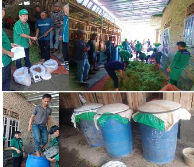
Gambar 3. Pelatihan pembuatan complete feed dengan metode silase sebanyak 3 tong kapasitas 200 kg

Bahan pakan yang digunakan pada kegiatan pengabdian ini yaitu rumput Pakchong, dedak, onggok, DDGS, bungkil kelapa, mineral premix Lagantor®, dan molases. Sebelum pelatihan pembuatan complete feed dimulai, maka tim memberikan pengenalan bahan pakan tersebut dan menjelaskan tiap kandungan protein kasar didalamnya serta metode pencampuran tiap bahan sehingga tercampur homogen. Pelatihan pembuatan complete feed dengan metode silase ini diikuti oleh 14 orang peternak ruminansia kecil dengan rata-rata jumlah pemeliharaan ternak sebanyak 3 hingga 20 ekor kambing/domba dengan memadatkan campuran bahan pakan kedalam tong fermentor sehingga proses fermentasi berlangsung secara anaerob. Pelatihan fermentasi pakan menggunakan metode silase dengan penambahan berbagai konsentrat untuk menjadi pakan komplet ( complete feed ) disajikan pada Gambar 3.