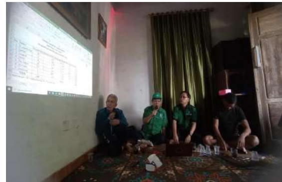
Gambar 2. Sosialisasi materi oleh tim PKM

Kegiatan pengabdian ini diawali dengan melakukan sosialisasi materi untuk memberikan peningkatan pengetahuan terhadap peserta pengabdian. Kegiatan pengabdian ini merupakan bentuk pendidikan dan pelayanan kepada masyarakat. Ermawati et al. (2022) menyatakan bahwa kegiatan penyuluhan dan pelatihan fermentasi pakan memberikan peningkatan pengetahuan peternak pada sisi arti penting penerapan fermentasi pakan. Materi yang disampaikan dalam kegiatan sosialisasi ini yaitu teknologi fermentasi pakan, formulasi ransum complete feed , dan manajemen Reproduksi Ruminansia Kecil (Gambar 2)