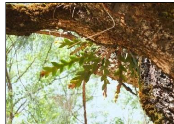
Gambar 5. Appendikula reflexa Bl