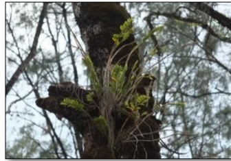
Gambar 6. Dendrobium secundum