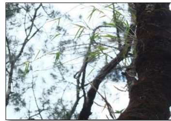
Gambar 3. Liparis crenulata