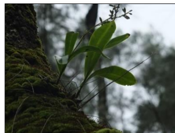
Gambar 4. Dendrobium sagittatum